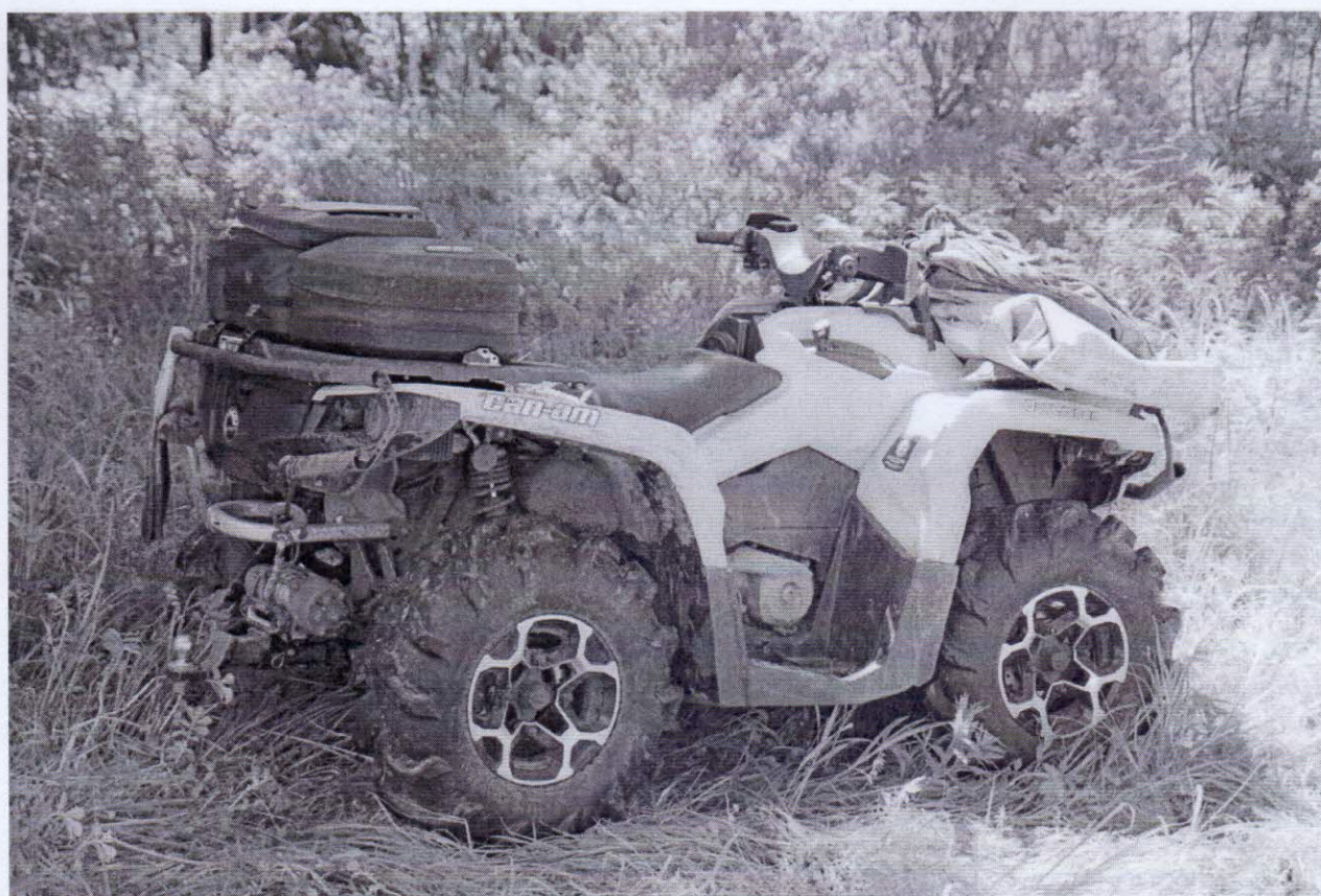
Рисунок 3 – Средство передвижение №2 на маршруте