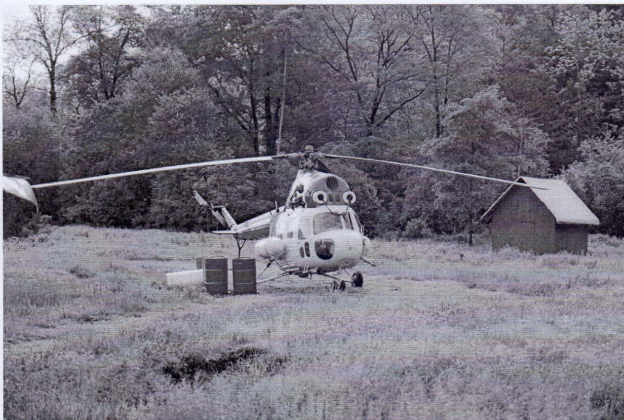
Рисунок 2 – Средство передвижение №1 на маршруте