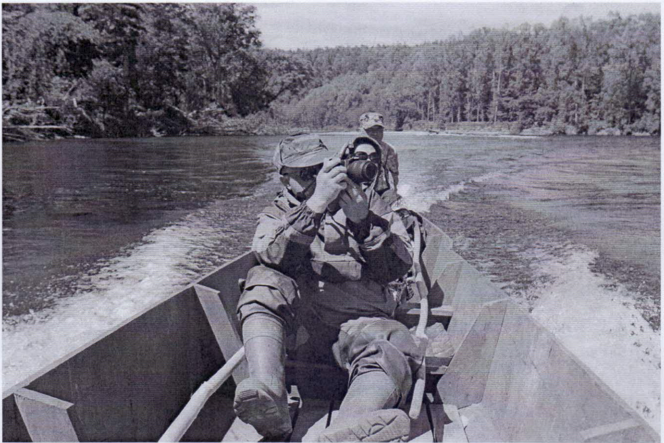
Рисунок 4 – Живописные ландшафты вокруг