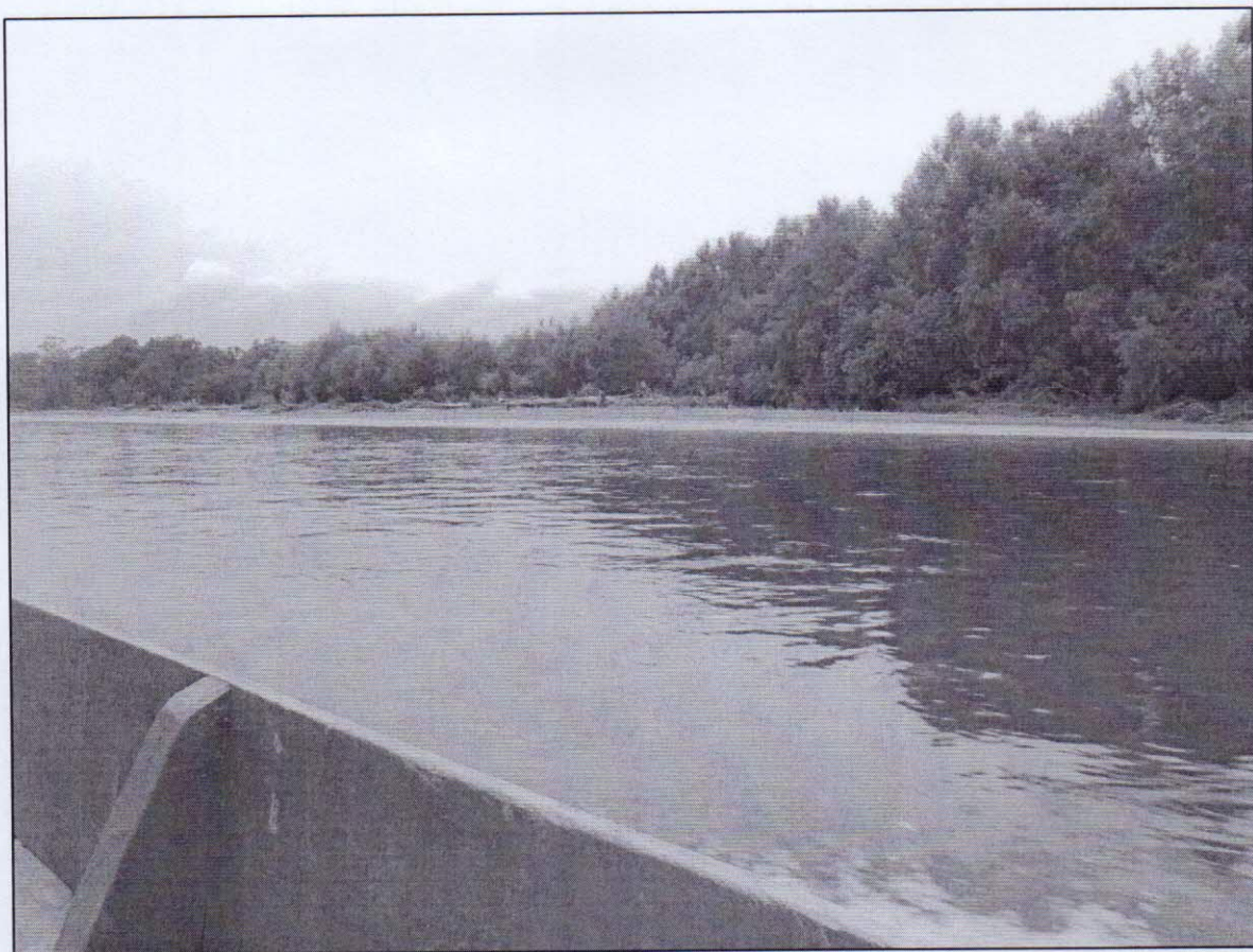
Рисунок 7 – возможное место для остановки