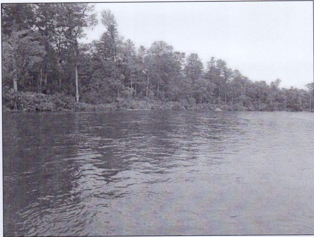
Рисунок 3 – вид из далека