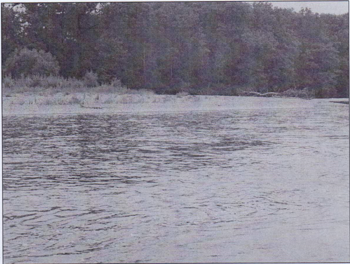
Рисунок 5 – возможное место для остановки