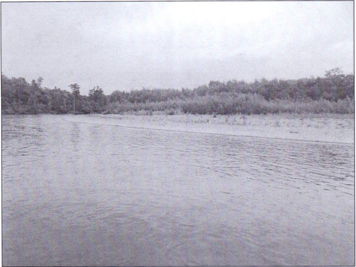
Рисунок 9 – возможное место для остановки