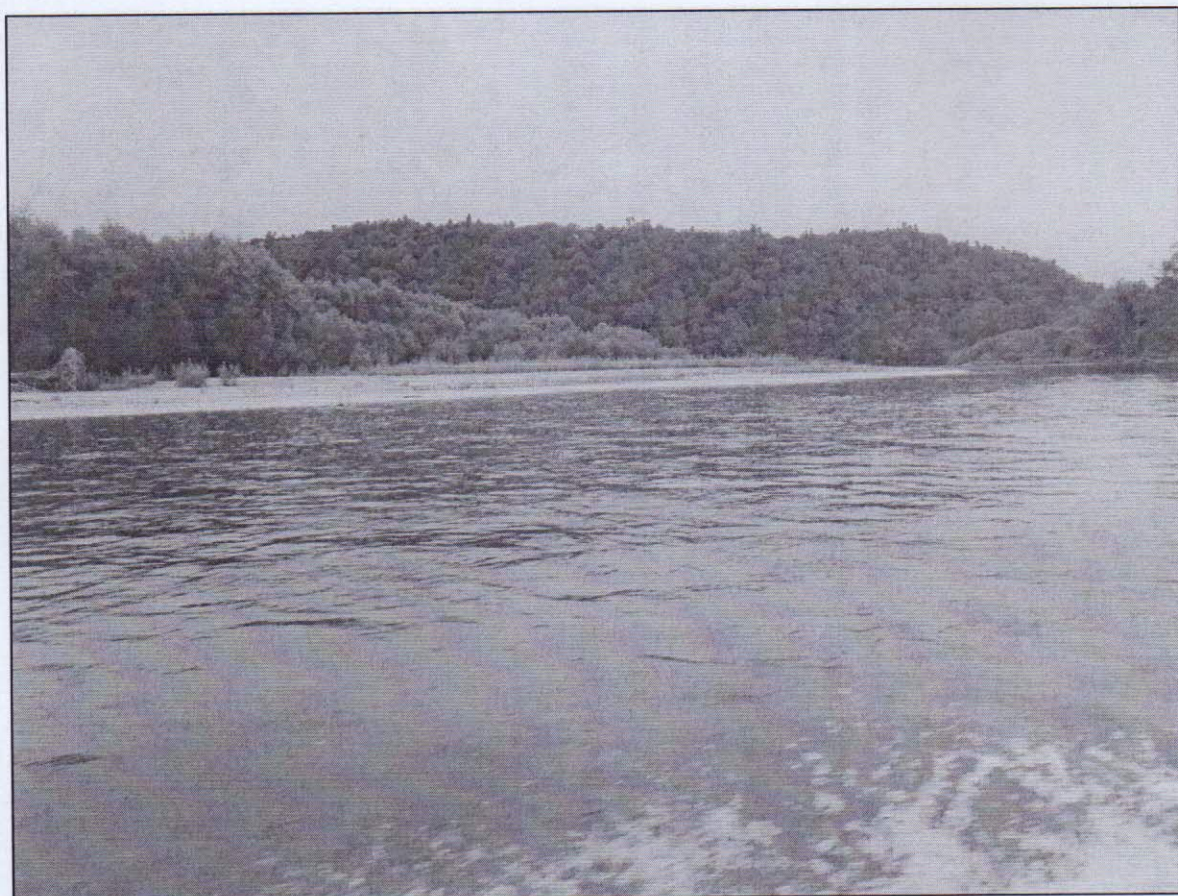
Рисунок 8 – возможное место для остановки