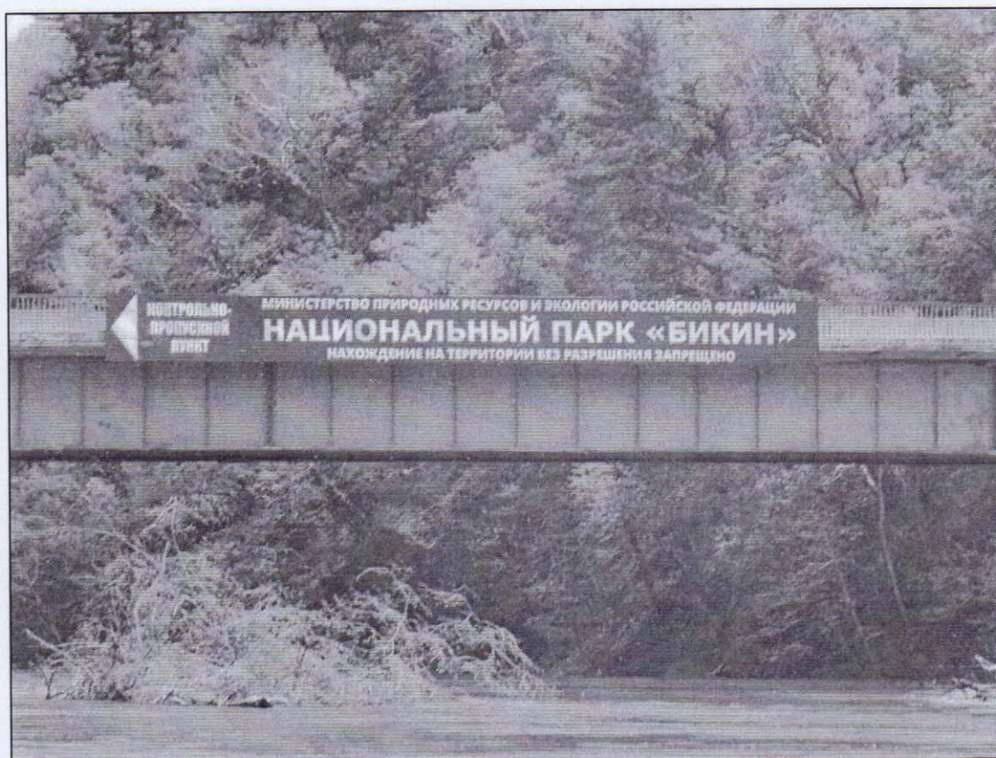
Рисунок 1 – Начало туристического маршрута № 4 «Тахало»